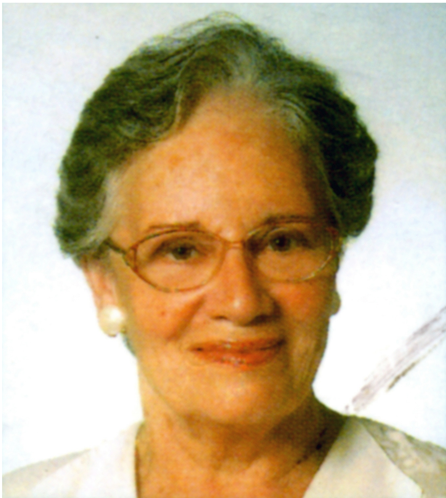
Maria Alberta Menéres